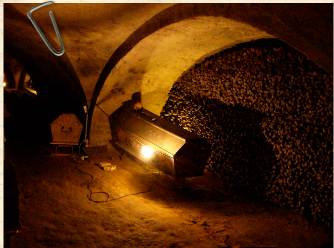
Die Michaelergruft ist ein Beinhaus- & Gruften-Geheimtipp mitten in der Wiener City, in dem sich natürliche Mumien entdecken lassen.

- zum Aufwärmen & Ausruhen bei leckerstem Kuchen ab ins überirdische „Café Diglas“ hinterm Stephansdom in der Wollzeile 10 - immer geöffnet von 8:00 - 22:30 Uhr